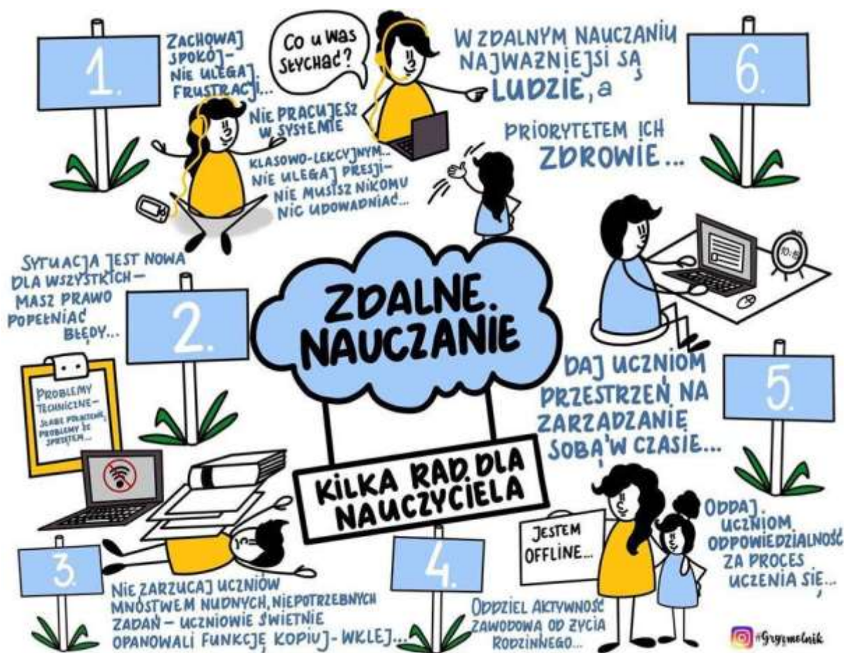
Autor grafiki: Barbara Grzelak MYŚLOGRAFIA